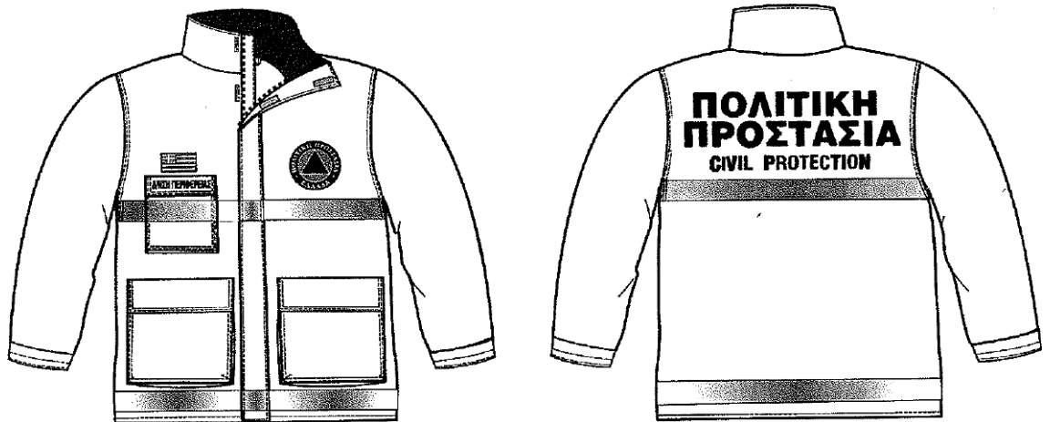
Εικόνα 1. Επιχειρησιακά μπουφάν Πολιτικής Προστασίας

Σύμφωνα με το 4678/22-11-2004 έγγραφο ΓΓΠΠ, τα επιχειρησιακά μπουφάν Πολιτικής Προστασίας θα πρέπει να έχουν την ακόλουθη μορφή: